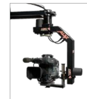
MovieJib with remote head use (s. page 90-91) MovieJib mit Remote Head Einsatz (s. Seite 90-91)