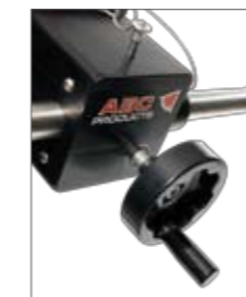
Crank for stepless weight balancing of the Jib Kurbel zur stufenlosen Gewichts-Tarierung des Jibs