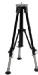
Item No. Art. Nr. 8321-03