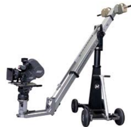
Crane accessories s. page 70 Kran-Zubehör s. Seite 70