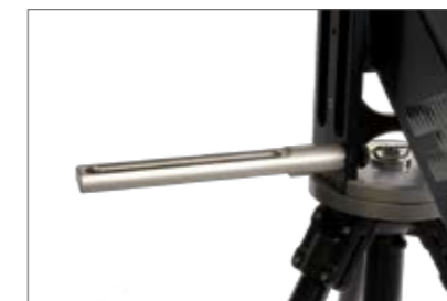
Optional monitor holder "MovieJib" Optional Monitor Halter "MovieJib" Item No. Art. Nr. 8315-30