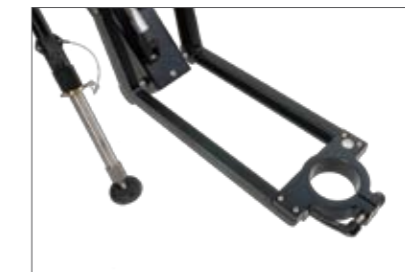
Flexibel mounting position of ball adapters etc. Flexible Montageposition für Kugelschalen-Adapter usw.