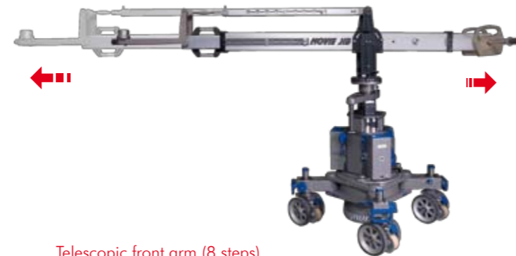
Telescopic front arm (8 steps) Teleskopsystem für Kranausleger (8 Stufen)